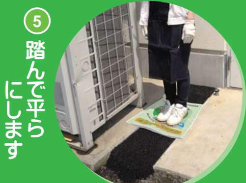
⑤ 踏んで平らにします

空き袋を敷き、足でしっかりと踏み固め、平らにします。凹凸が気になる場合は、レンガ等で平らにしてください。